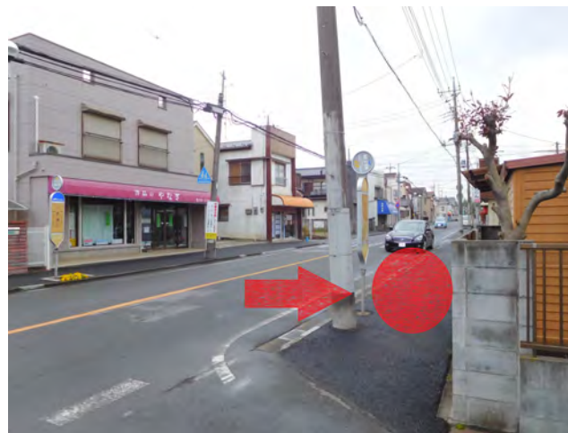
十条通り旧バス停(洋品のやなぎ反対側)