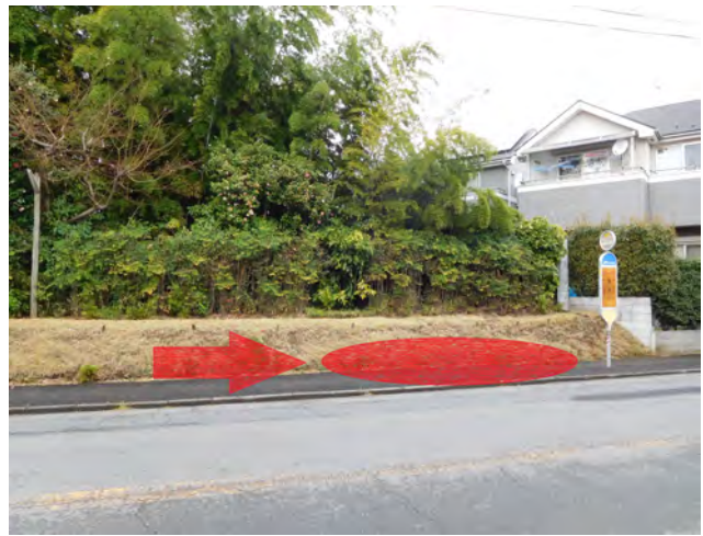
一条通り旧バス停(竹やぶ付近)