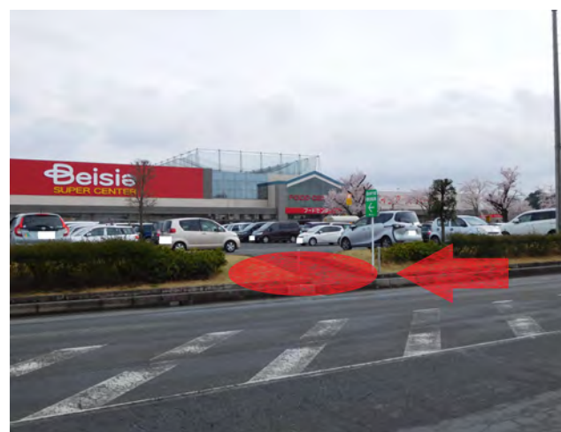
ベイシア日高モール(丸亀製麺先、緑看板付近)