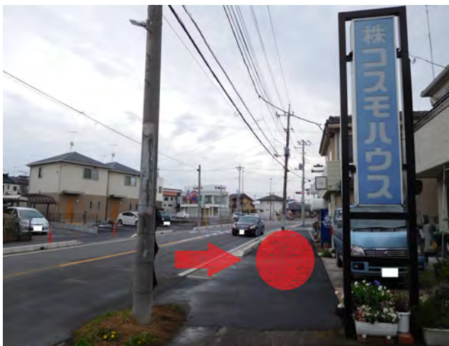
日高団地入口旧バス停(コスモハウス付近)